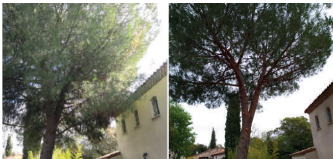
Chantier d'élagage à Buzignargues, géré par le pôle v&d.