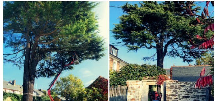
Abattage d'un cèdre malade à Nantes, géré par le pôle väd.

Ainsi, le Groupe innove et adopte un système de vente initialement conçu pour la vente de produits !