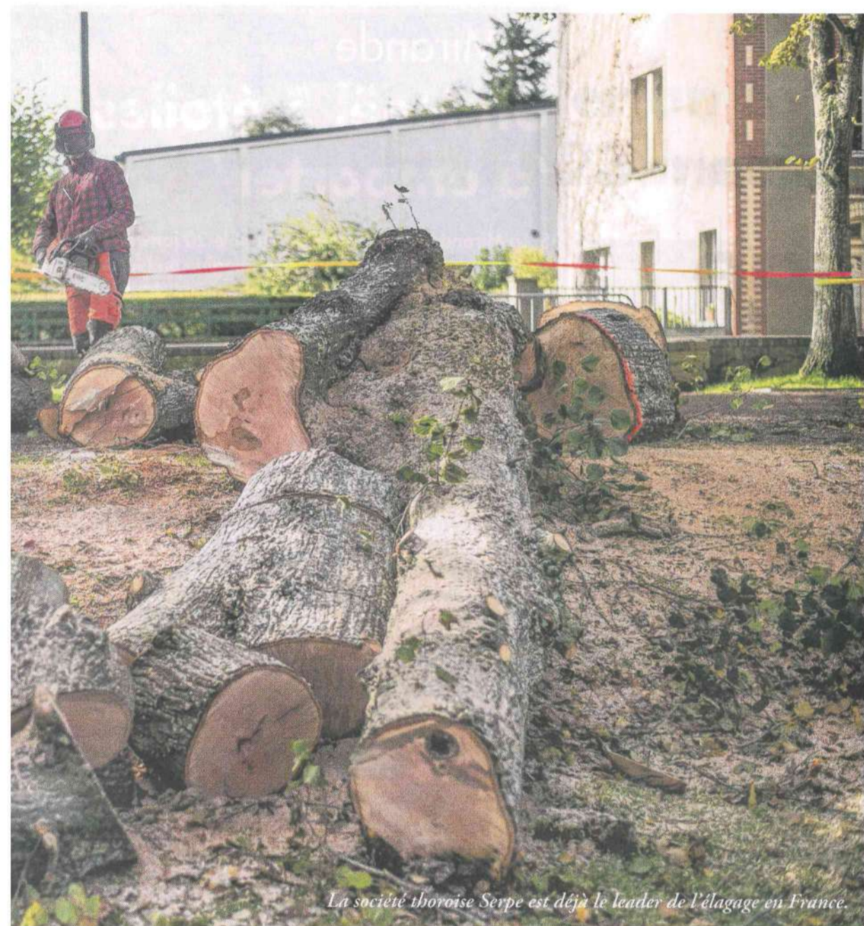
La société thiroise Serpe est déjà le leader de l'élagage en France.

nous imposer davantage dans le Sud-Est mais aussi sur le territoire national grâce à des moyens humains et matériels plus importants. En étoffant notre offre, nous couvrons ainsi l'ensemble des besoins de nos clients sur une même entité et ce sur la quasi-totalité du territoire national grâce à notre réseau d'agences. » Grâce à la création de synergies nouvelles entre les deux structures, cette acquisition permettra également au groupe Serpe de renforcer sa présence sur les marchés d'espaces verts nationaux et de consolider sa crédibilité commerciale sur des marchés plus importants.