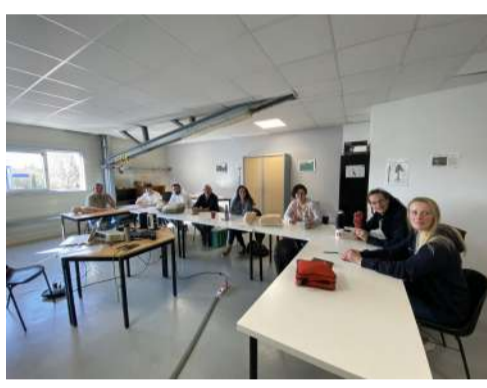
Retrouvez notre post LinkedIn sur le SST

La Serpe propose à tous ses collaborateurs la possibilité de réaliser une formation de sauveteur secouriste du travail (SST).